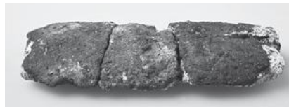
黒漆喰仕上げ 海鼠漆喰

※期間中の下記日時に河北門会場において所員による 展示解説を行います。 10月9日(土)・17日(日)・24日(日) 11月6日(土)・13日(土) 午後2時～3時