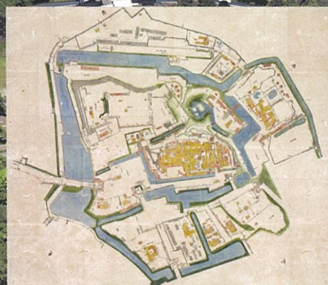
横山隆昭氏蔵「御城中巻分基絵図」