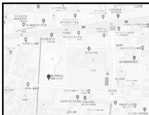
野々市市文化会館フォルテ 【野々市会場】