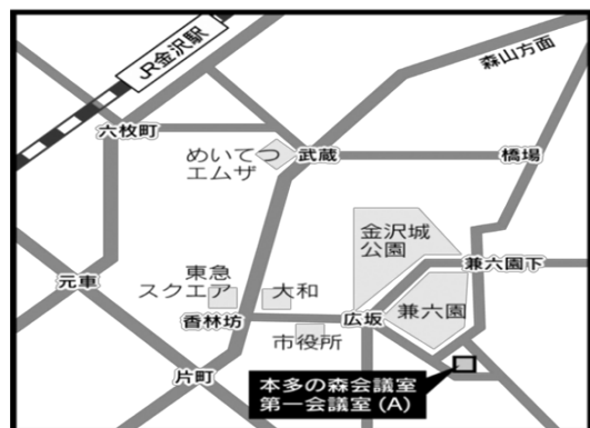
本多の森会議室 (石川県本多の森庁舎内) ※石引駐車場無料割引有