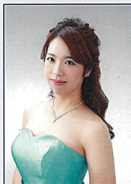
メゾ・ソプラノ 前澤 歌穂