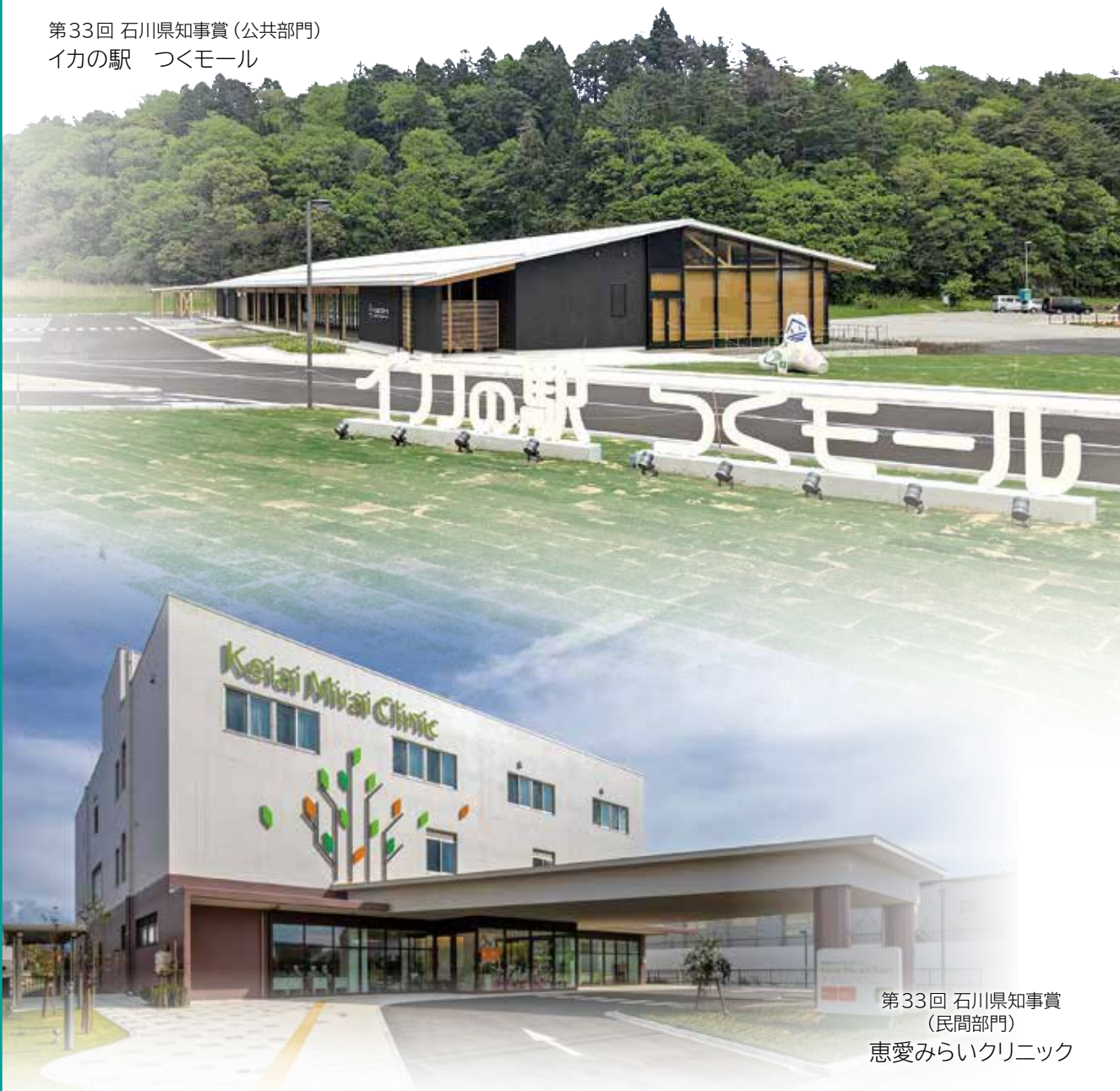
第33回 石川県知事賞 (民間部門) 恵愛みらいクリニック