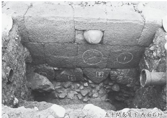
五十間長屋下 西面石垣