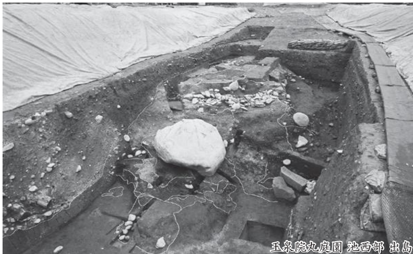
玉泉院丸庭園 池西部 出島