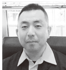
総務省消防庁 国民保護運用室長