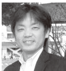
北陸学院大学 人間総合学部教授