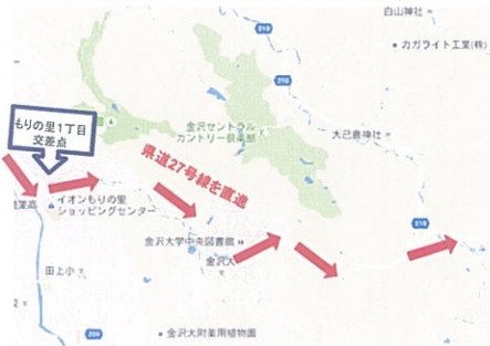
①もりの里1丁目交差点から県道27号線まで