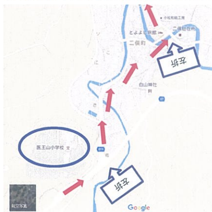
②医王山小学校を左折後、県道211号線まで