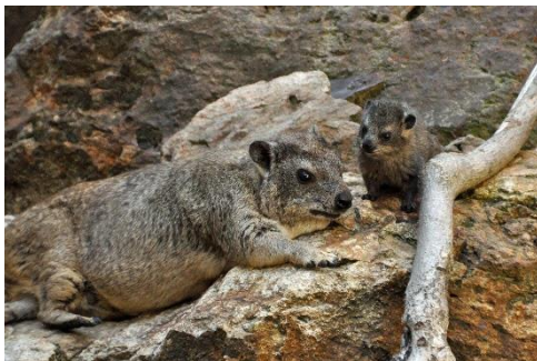
ケープハイラックスの親子