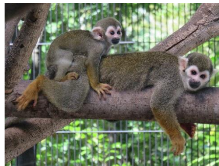
コモンリスザルの親子