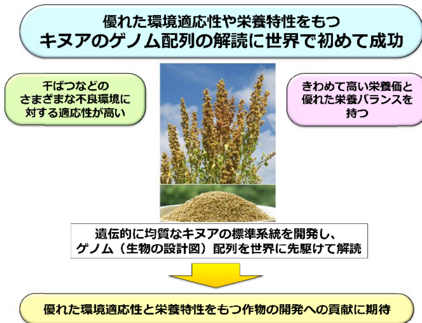
図 3.キヌアのゲノム解読が切り拓く新たな作物改良への展開

キヌア遺伝子とヒユ科近縁種（テンサイ、ハウレンソウおよびアマランサス）およびモデル植物のシロイヌナズナの遺伝子を比較した。各区画において、数字は類似の遺伝子をまとめたグループの数を示します。5 種類の植物すべてに共通する遺伝子グループは、3,342 種でした（図の中心の区画）。キヌアだけにみられる遺伝子は 13,320 種でした（図の左上の区画）。