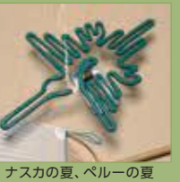
ナスカの夏、ペルーの夏

お菓자에駄菓子があるように、美術にも「駄美術」があってもいいのでは？の発想のもと、遊び心溢れる作品を展示します。