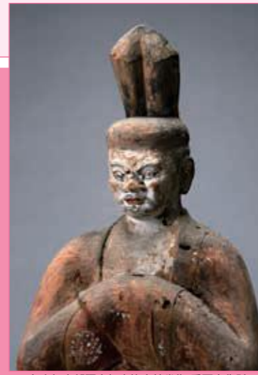
久麻加夫都阿良加志比古神坐像 重要文化財 (くまかぶとあらかしひこしんざう)