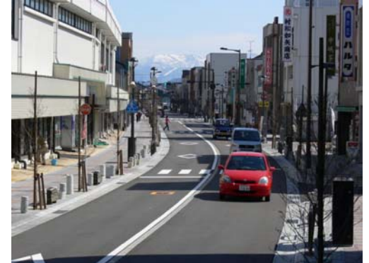
電柱地中化が完了した千代尼通り