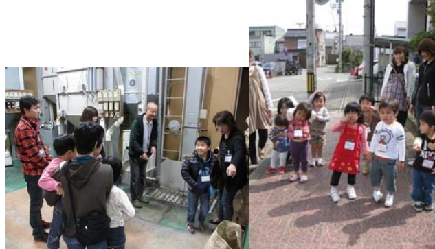
子どもたちの学ぶ場を提供