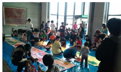
イベントの運営などに金城大学が積極的に参加