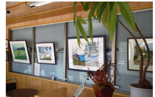
地元在住の芸術家の作品展示（千代尼通りアートフェスティバル）