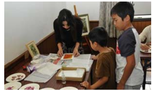
団体同士の交流拠点・交流事業を積極的に展開