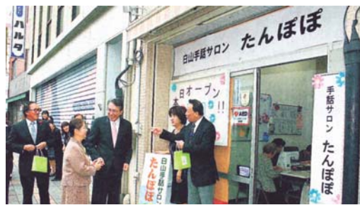
既存の障害者団体と地域住民の交流の場を活用した事業の展開