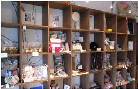
作品の発表と販売を兼ねた常設スペースの設置

地域住民や地域の各種団体に、活動の発表の場や他団体との交流の場を提供し、交流拠点としての機能の充実を図る。