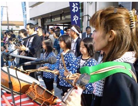
地域の大人から子どもへの伝統芸能の継承

地域の大人から子どもへ伝統芸能の継承、子育て支援NPOと連携した商店街をフィールドとした子育て支援、店主が講師となった「まちの知っ得！セミナー」の開催など、世代間、住民間の交流促進を図る。