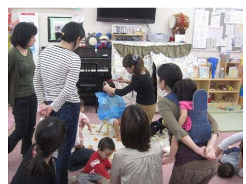
店主が講師となったセミナーの開催