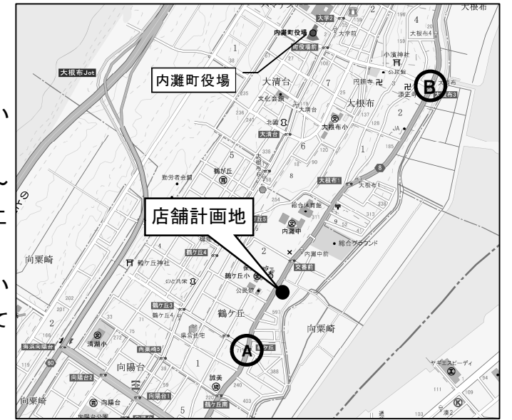
【交差点需要率の解析結果】

検討は、計画地近傍の信号交差点（右図 A～B）における「※交差点需要率」を解析することにより、周辺交通への影響を判定しました。解析の結果は以下のようになり、開店後においても店舗周辺における交通処理は可能と考えております。