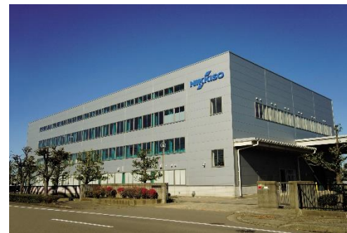
日機装(株)(日機装技研)