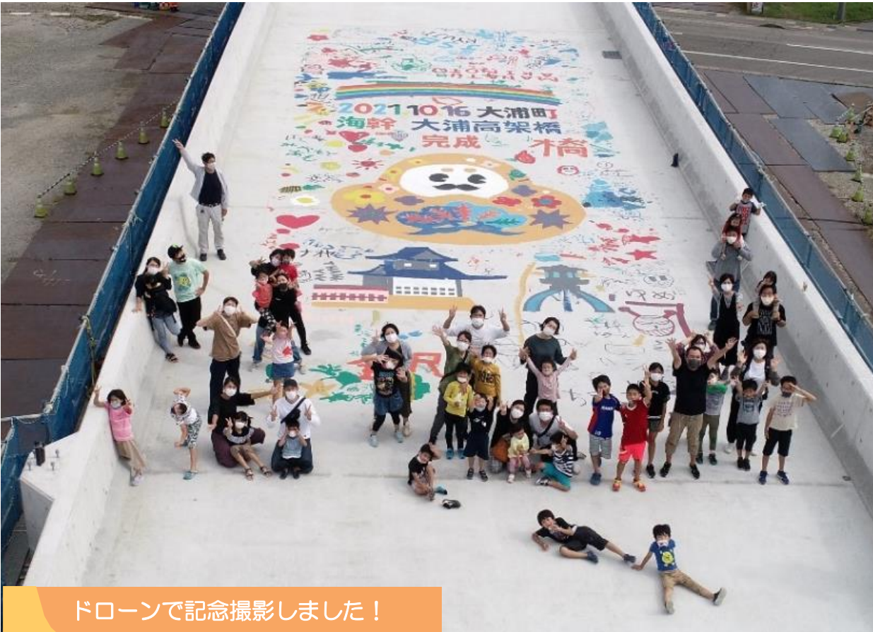
ドローンで記念撮影しました！