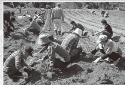
サツマイモの収穫