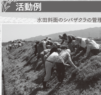
水田斜面のシバザクラの管理