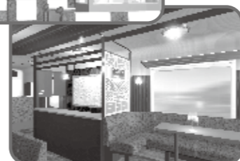
サービスカウンター(車内販売)