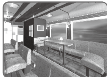
海向き展望シート+能登ヒバのテーブル