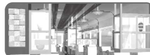
ミニギャラリー(伝統工芸品等)

北陸新幹線開業後にのと鉄道が運行を開始する観光列車「のと里山里海号」。訪れる観光客に、世界農業遺産の認定を受けた能登の里山里海の魅力を感じていただけるよう、ダイヤ編成やサービス内容などを工夫し、おもてなしの心で運行していきます。