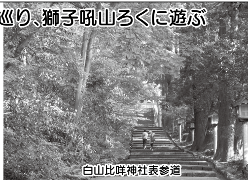
白山比咩神社表参道

開催日 毎日 参加費 500円(小学生以下は無料) 申込先 NPO法人加賀白山ようござつた ☎076-273-5699