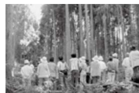
▲森林環境実感ツアー

税の一部を活用して、県民の皆様へ強度間伐を実施した現場を見学してもらう「森林環境実感ツアー」や、県民森づくり大会、森林ボランティア活動などを開催しています。