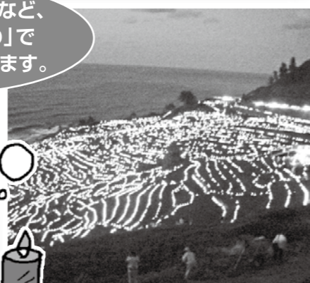
白米千枚田(輪島市)