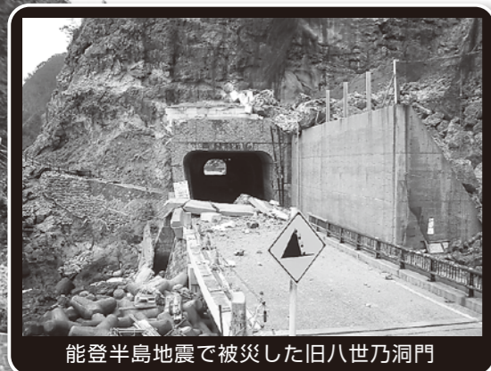
能登半島地震で被災した旧八世乃洞門

11月1日、輪島市町野町曾々木と珠洲市真浦町を結ぶ八世乃洞門新トンネルが開通しました。これまでの八世乃洞門は、平成19年3月に発生した能登半島地震の余震で破損し、片側交互通行・夜間通行止めが続いていました。また現地には不安定な岩塊が広い範囲に存在しており危険な状態でしたが、今回の新トンネル開通で、より安全で安心な通行ができるようになりました。新トンネルの完成は、能登半島地震からの復旧工事の総仕上げとも言えます。「持続可能な能登の再生と創造」のシンボルとして、人・ものの交流促進に貢献するものと期待されます。