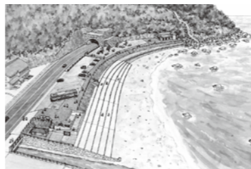
真浦ポケットパークのイメージ