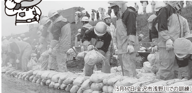
(5月17日 金沢市浅野川での訓練)

新しい水防計画に基づき、県、市、住民が一体となった情報伝達などの合同訓練を実施します。(各土木事務所で順次実施)