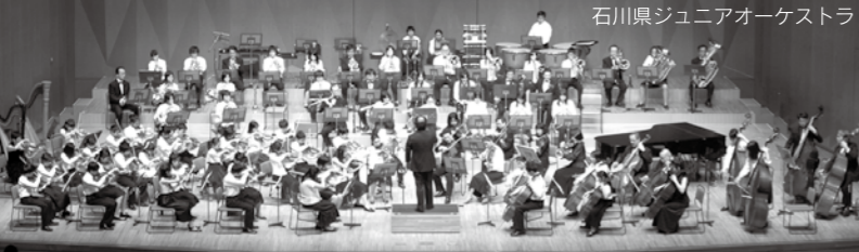
石川県ジュニアオーケストラ

とき 13:30~14:45 ところ 県立音楽堂交流ホール 講師 ジャン・ワン(チェロ)、ホアン・モンラ(ヴァイオリン) 出演 石川県ジュニアオーケストラ