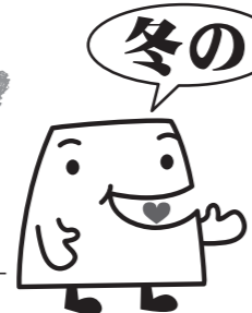
イメージキャラクター「のとん」

冬の能登半島には、加能ガニや能登寒ぶりをはじめ、甘えびに能登かき、能登牛(のとうし)など食の魅力がいっぱい。1年のうま味がぎゅっと詰まったこの時期に、冬の「能登ふるさと博」を初開催します。