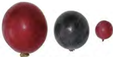
※左からルビーロマン、巨峰、デラウェア

この中から、味、色、粒の大きさなど調査を繰り返して、選ばれた1本が「ルビーロマン」です。