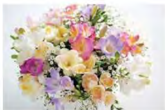
写真の花束はイメージです