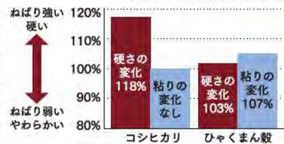
【20℃で48時間保存後の変化】

一粒ひと粒が大きく、炊き上がりはさらにボリューム感があります。お米の旨みを感じられ、味わい、食感ともに食べ応えがあります。