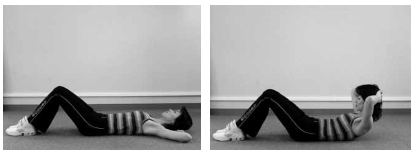
図 IV-2 筋力トレーニング（腹筋）

なお、筋力トレーニングでは、 階段の昇降や15分程度の歩行等で膝の痛みが出る方は、運動をする際に医師又は指導者と相談しましょう。