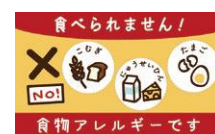
食物アレルギーを知らせる表示カード