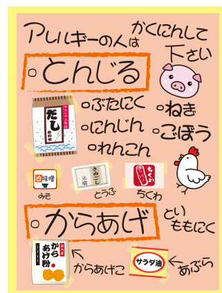
実際に炊き出しのときに掲載した一例