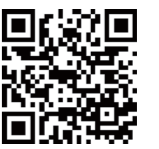
女性が個別検診受診票 申込用QRコード