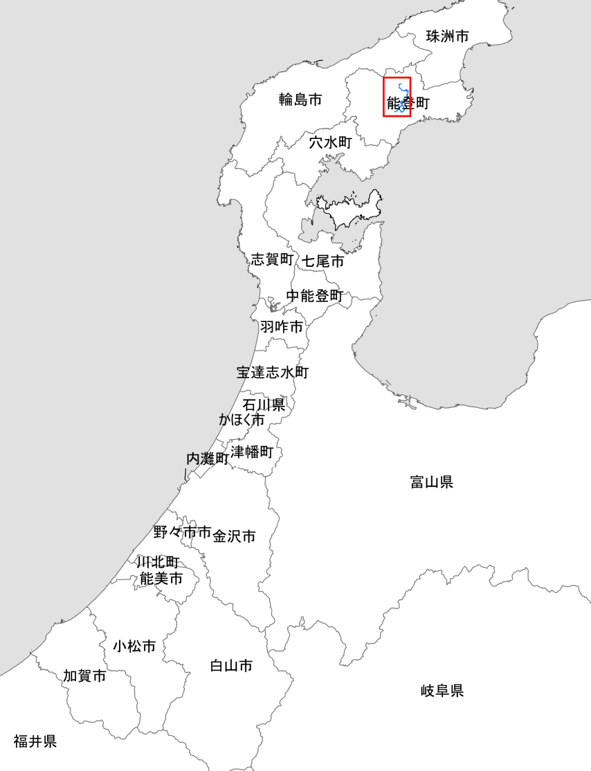
町野川水系上町川・神野川洪水浸水想定区域(想定最大規模)