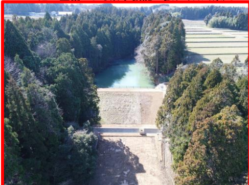
ため池の整備による治水機能の強化（石川県）