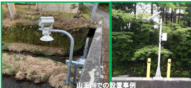
山王川での設置事例