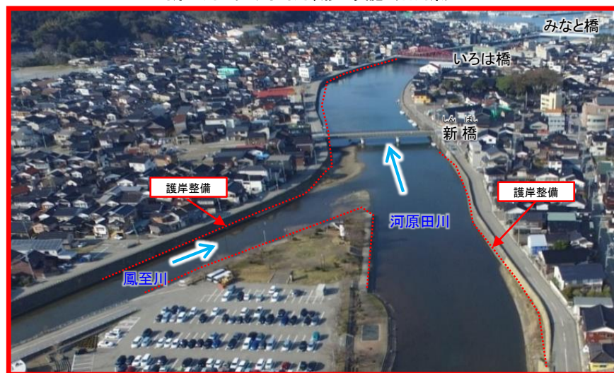
河原田川における河川改修の実施（石川県）