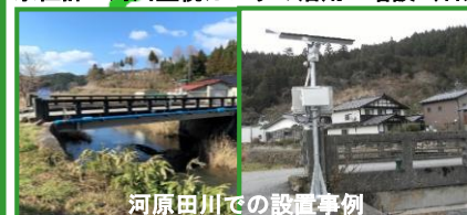
水位計・河川監視カメラの活用・増設（石川県）