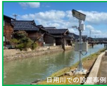
日用川での設置事例