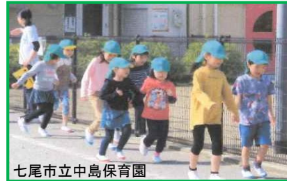
七尾市立中島保育園