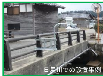
日用川での設置事例