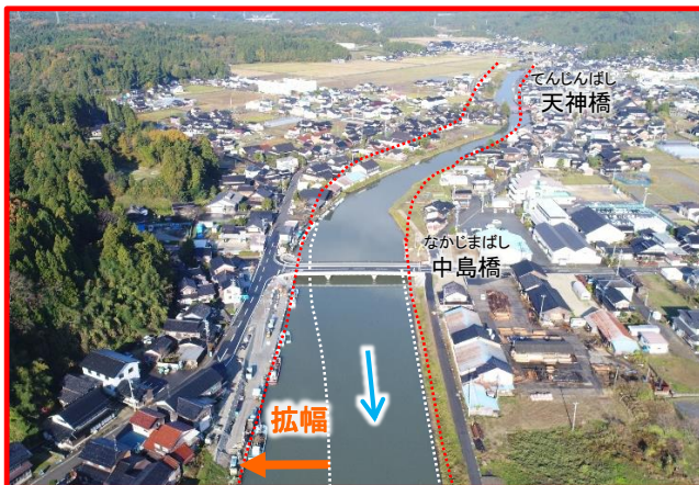
熊木川における河川改修の実施(石川県)