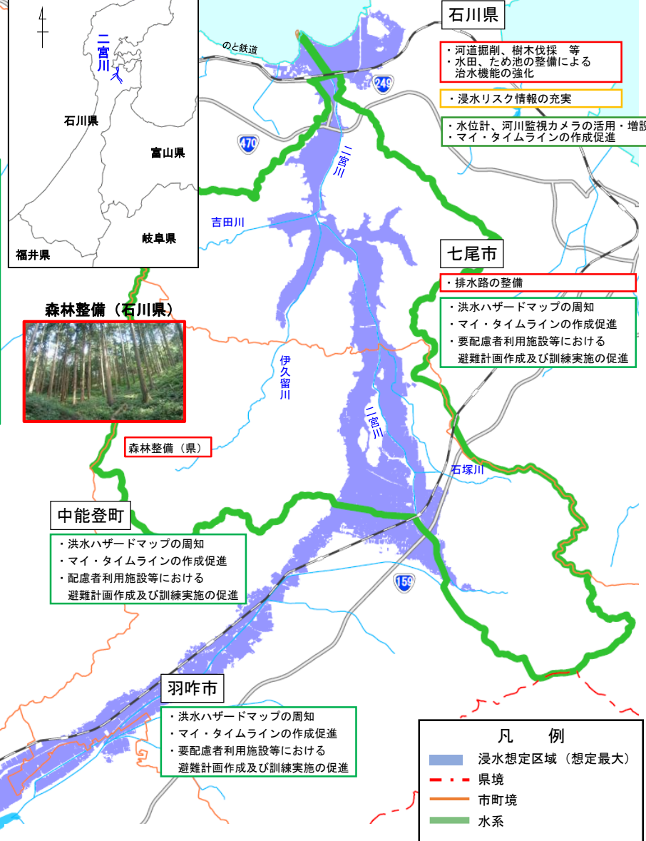
二宮川における河道掘削、樹木伐採（石川県）