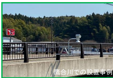
鷹合川での設置事例