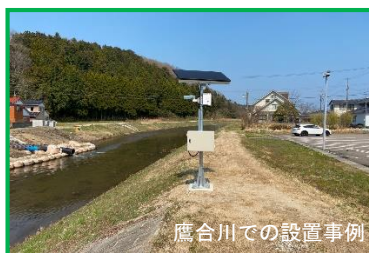
鷹合川での設置事例