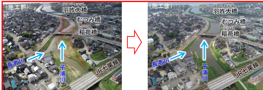
子浦川における河道掘削、樹木伐採 (石川県)