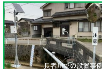
長者川での設置事例