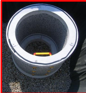
雨水浸透施設の整備(金沢市)