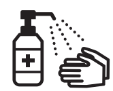
手指消毒用アルコール による消毒の励行

新型コロナワクチンの詳しい情報については、厚生労働省のホームページをご覧ください。