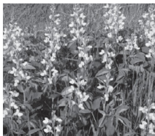
センダイハギ (マメ科)