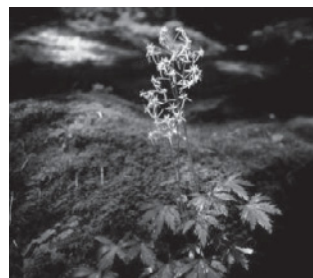
エチゼンダイモンジソウ (ユキノシタ科)