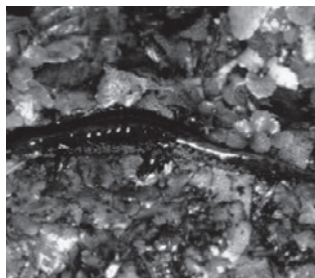
ホクリクサンショウウオ (サンショウウオ科)