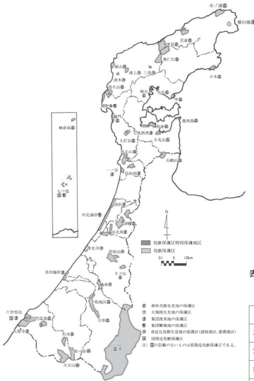
表11 鳥獣保護区の指定面積と県土面積に占める構成比