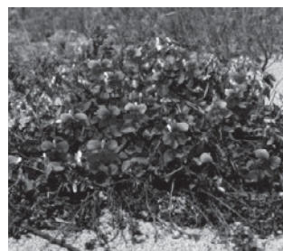
イソスミレ (スミレ科)