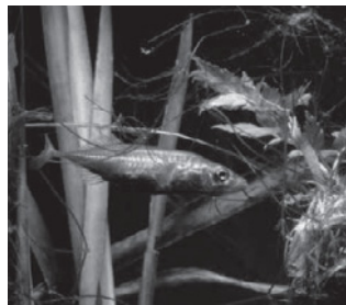
トミヨ (トゲウオ科)