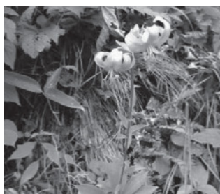
サドククルマユリ (ユリ科)