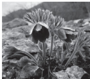
オキナグサ (キンポウゲ科)