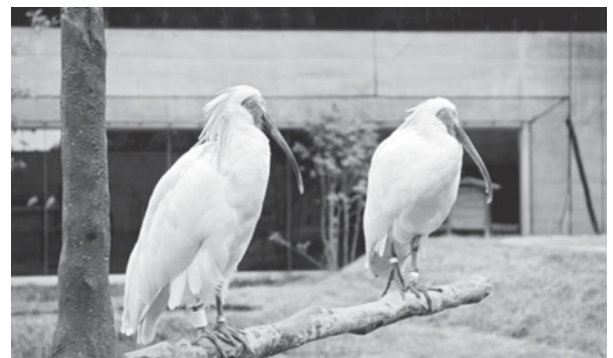
いしかわ動物園で分散飼育中のトキ