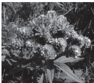
ヒメヒゴタイ (キク科)