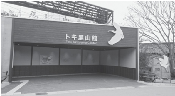
トキ里山館（平成28年11月オープン）

今後も、トキを通じて里山の利用保全を推進するなど、人と自然の共生の取組を進めていきたいと考えています。