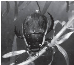
シャープゲンゴロウモドキ (ゲンゴロウ科)