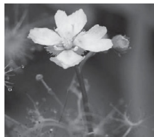
イシモチソウ (モウセンゴケ科)