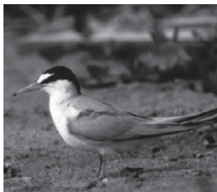
コアジサシ (カモメ科)