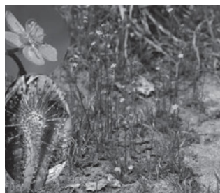
トウカイコモウセンゴケ (モウセンゴケ科)