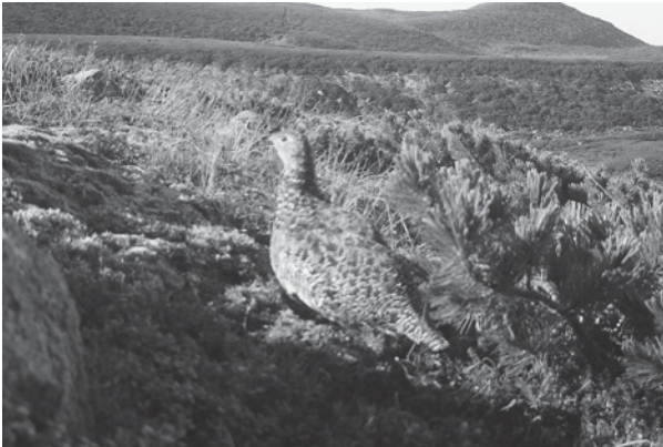
白山のライチョウ（平成27年8月24日撮影、環境省中部地方環境事務所）

白山は、かつてのライチョウの生息地であり、平成21年6月のライチョウの再確認は、大きなニュースとなって県民に明るい話題を提供しました（のちの調査で平成20年にライチョウが確認されていたことが判明）。確認されたライチョウは、メスの1羽だけでしたが、白山の自然の豊かさを象徴しています。今後も県では、環境省と連携し、ライチョウの目撃情報の把握に努めてまいります。