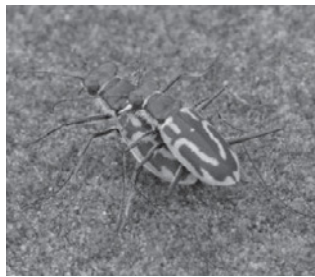
イカリモンハンミョウ (ハンミョウ科)