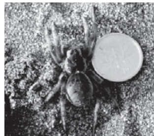
イソコモリグモ (コモリグモ科)