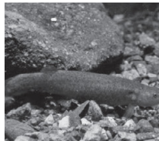
ホトケドジョウ (ドジョウ科)