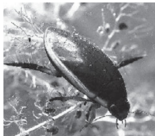
マルコガタノゲンゴロウ (ゲンゴロウ科)