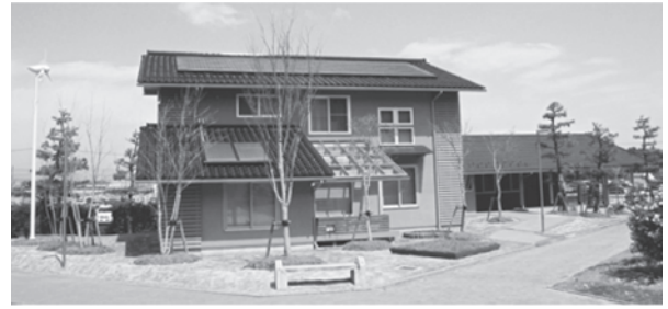
いしかわエコハウス

特徴：高气密・高断熱（断熱材、二重ガラス窓）施工 住宅用太陽光発電パネル（段状に設置するパネル、屋根一体型のパネル）の設置 卓越風を考慮し、自然風を多く取り入れる工夫（建物の向き、窓の位置等）など