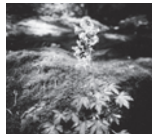
エチゼンダイモンジソウ (ユキノシタ科)