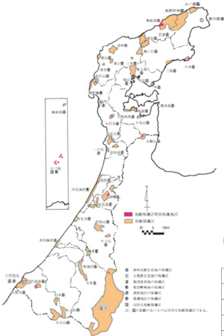
図2 鳥獣保護区と指定等現況図（平成28年3月末現在）