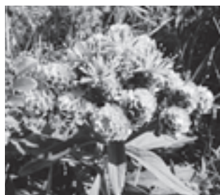
ヒメヒゴタイ (キク科)