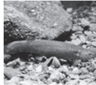
ホトケドジョウ (ドジョウ科)