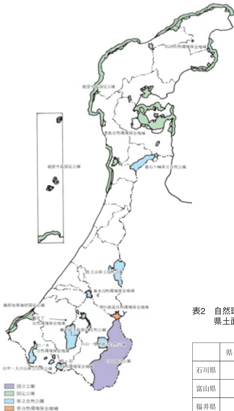
図1 自然環境保全地域と自然公園の指定現況図 (平成28年3月末現在)