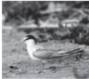
コアジサシ (カモメ科)