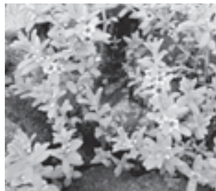
ウミミドリ (サクラソウ科)