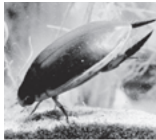
マルコガタノゲンゴロウ (ゲンゴロウ科)