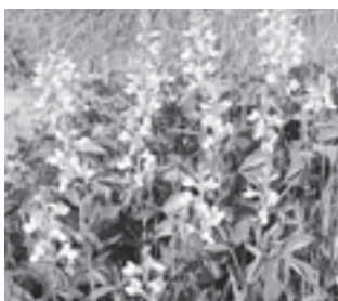
センダイハギ (マメ科)