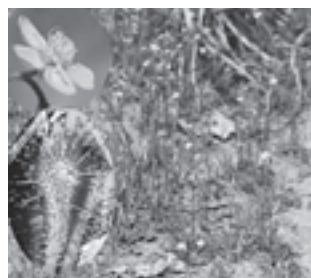
トウカイコモウセンゴケ (モウセンゴケ科)