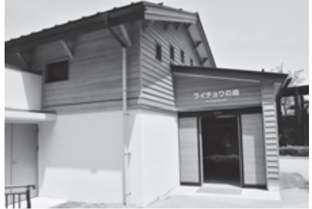
ライチョウの峰（平成23年4月オープン）

チョウをいしかわ動物園に受け入れ、飼育・繁殖技術の習得に取り組みはじめ、その拠点施設として、平成23年4月に「ライチョウの峰」をオープンさせ、この取組を県民に広く公開しています。