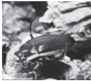
シャープゲンゴロウモドキ (ゲンゴロウ科)