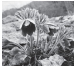
オキナグサ (キンポウゲ科)