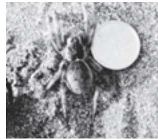
イソコモリグモ (コモリグモ科)