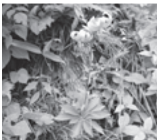
サドククルマユリ (ユリ科)