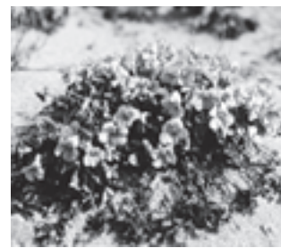
イソスマレ (スマレ科)