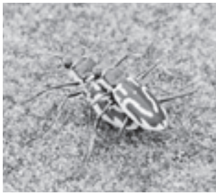
イカリモンハンミョウ (ハンミョウ科)