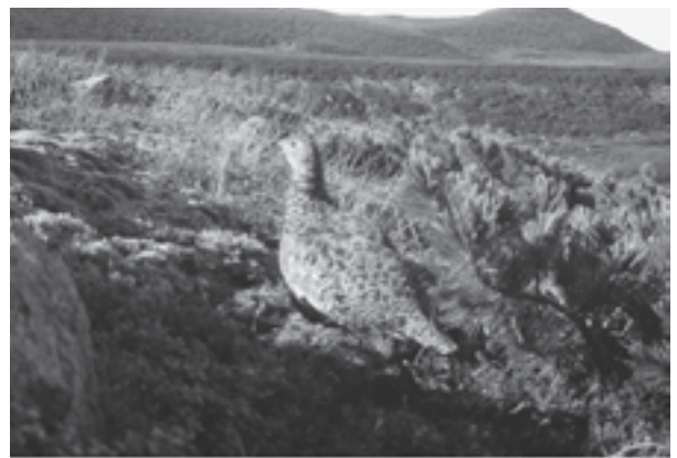
白山のライチョウ（平成27年8月24日撮影、環境省中部地方環境事務所）

白山は、かつてのライチョウの生息地であり、平成21年6月のライチョウの再確認は、大きなニュースとなって県民に明るい話題を提供しました。確認されたライチョウは、メスの1羽だけですが、平成27年もその生息が確認されており、白山の自然の豊かさを象徴しています。今後も県では、環境省に協力し、生息状況の把握に努めてまいります。