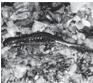
ホクリクサンショウウオ (サンショウウオ科)