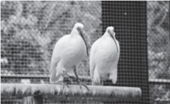
いしかわ動物園で飼育中のトキ

今後も、トキを通じて里山の利用保全を推進するなど、人と自然の共生の取組を進めていきたいと考えています。