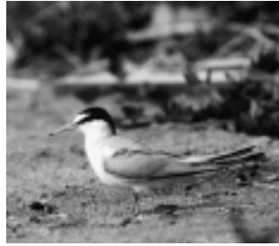
コアジサシ（カモメ科）