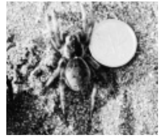
イソコモリグモ （コモリグモ科）