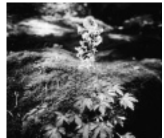
エチゼンダイモンジソウ （ユキノシタ科）