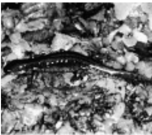
ホクリクサンショウウオ （サンショウウオ科）