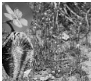
トウカイコモウエンゴケ （モウセンゴケ科）