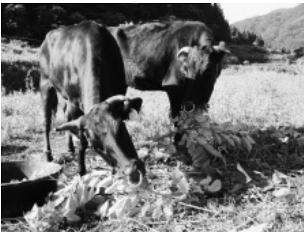
和牛放牧（白山市木滑）

放牧実施後はイノシシ被害やクマの出没が見られなくなったこと、雑草が採食されたことによって農地の荒廃が進むのを防止できたこと、飼料代の節約や放牧による住民への癒し効果な