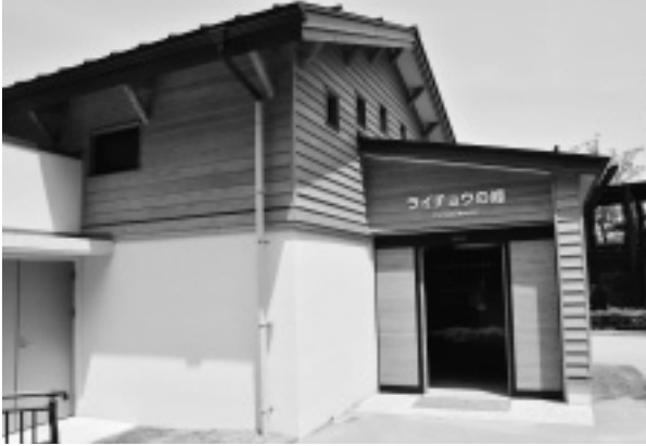
ライチョウの峰（平成23年4月オープン）

後も地球温暖化等による気温の上昇が進めば、将来的に絶滅する可能性がある種といえます。