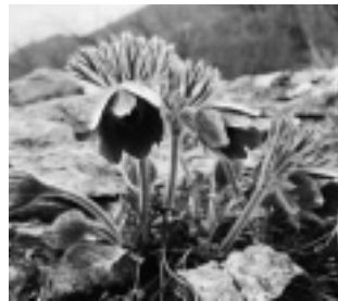
オキナグサ（キンポウゲ科）