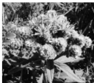
ヒメヒゴタイ（キク科）