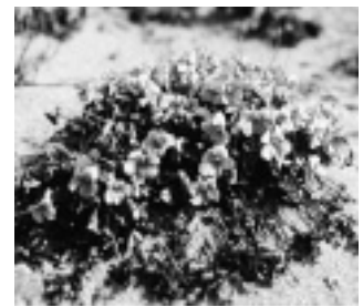
イソスミレ（スミレ科）