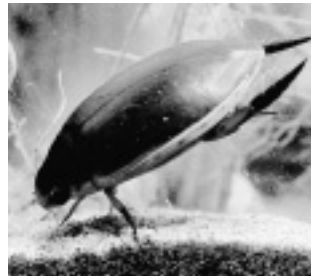
マルコガタノゲンゴロウ （ゲンゴロウ科）