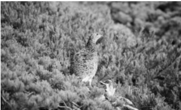
白山のライチョウ（平成22年8月4日撮影、白山自然保護センター）

白山は、かつてのライチョウの生息地であり、平成21年6月のライチョウの再確認は、大きなニュースとなって県民に明るい話題を提供しました。確認されたライチョウは、メスの個体1羽だけですが、翌平成22年そして平成23年になっても確認することができ、白山の自然の豊かさを象徴しています。平成23年10月には、環境省によって、個体識別のための足環が装着されました。今後も県では、環境省に協力し、生息状況やその生態の解明に努めてまいります。