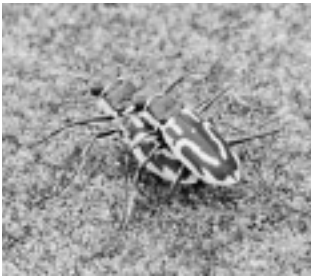
イカリモンハンミョウ （ハンミョウ科）