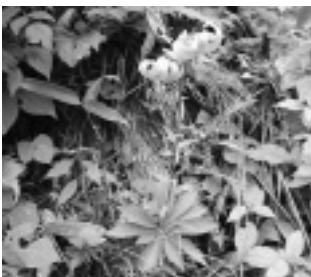
サドクマユリ（ユリ科）