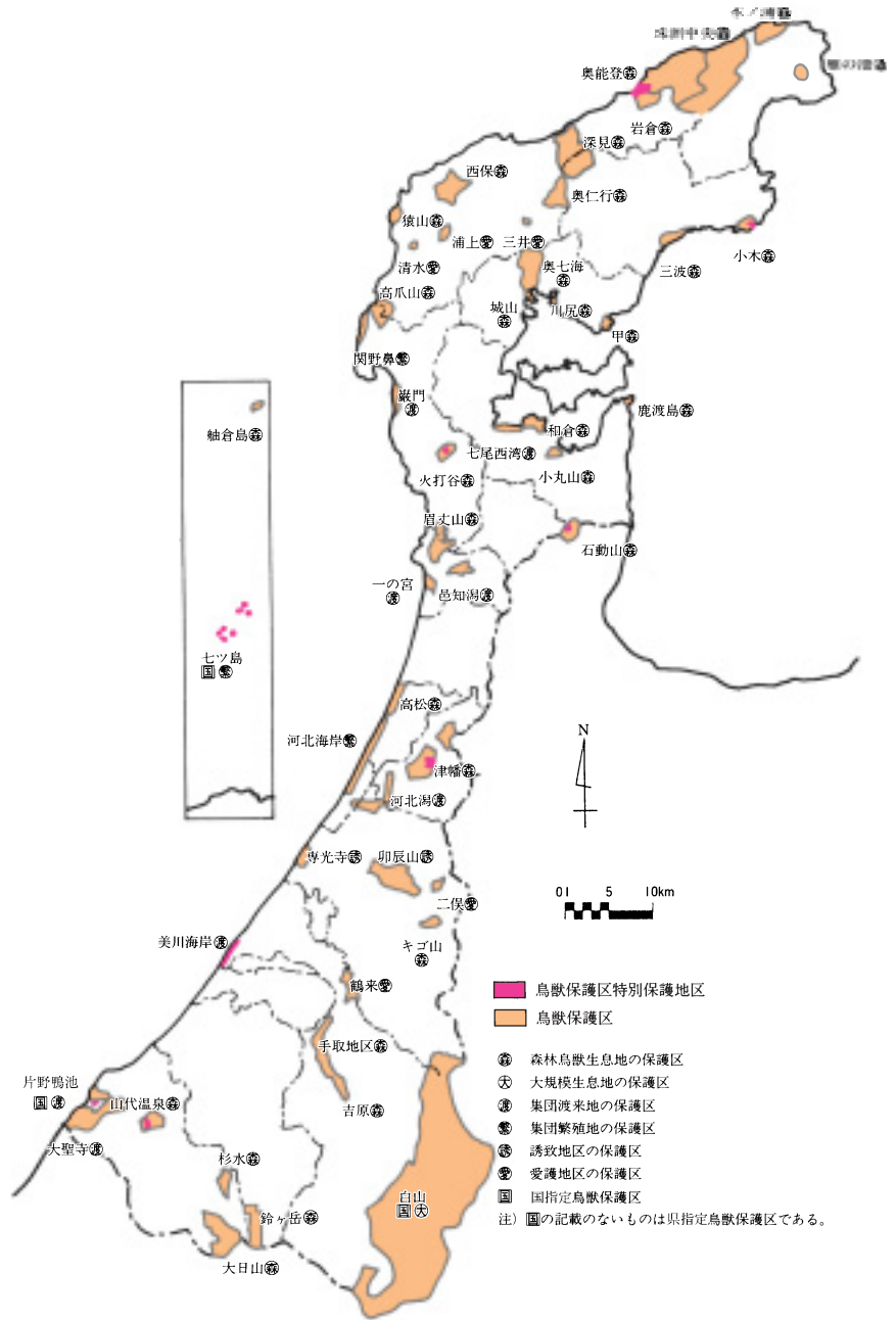
表12 鳥獣保護区の指定面積と 県土面積に占める構成比