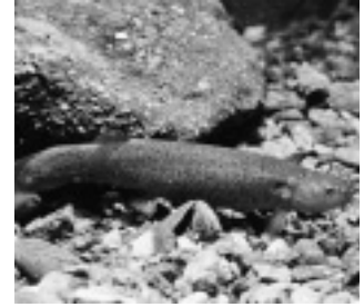
ホトケドジョウ （ドジョウ科）