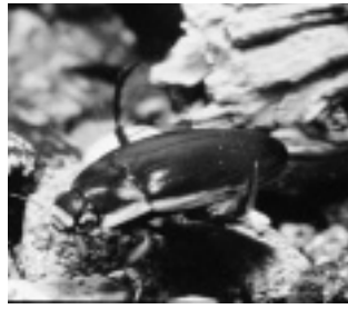
シャープゲンゴロウモドキ （ゲンゴロウ科）