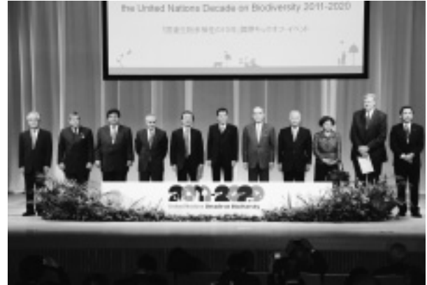
国連生物多様性の10年国際キックオフ・イベント (平成23年12月17日～19日)

1コース、金沢2コース、加賀1コース）でのエクスカージョンを実施し、各国の代表者らが世界農業遺産に認定された「能登の里山里海」をはじめとする本県の豊かな里山里海や地域の環境保全活動を視察しました。