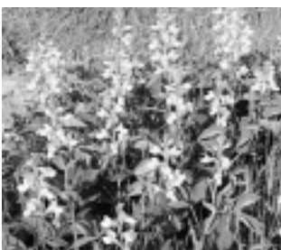
センダイハギ（マメ科）