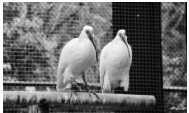
いしかわ動物園で飼育中のトキ

今後も、トキを通じて里山の利用保全を推進するなど、人と自然の共生の取り組みを進めていきたいと考えています。