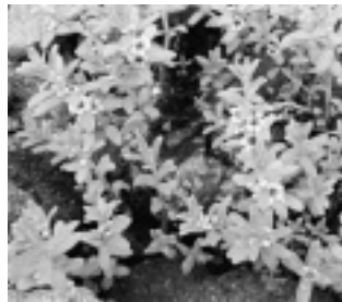
ウミミドリ（サクラソウ科）