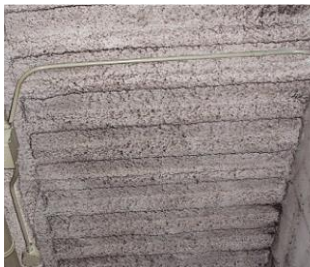
吹付けロックウール