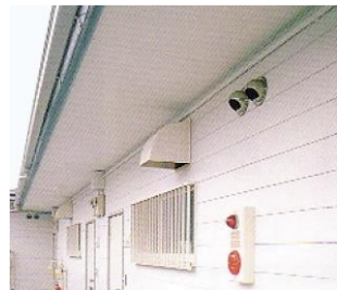
窯業系サイディング