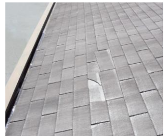
住宅化粧用スレート