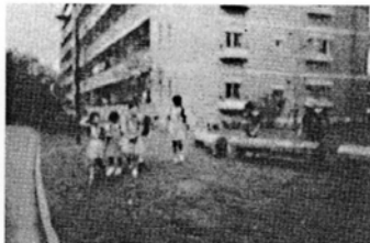
団地内にあった樹木を製材、加工して再利用したステップ、平均台