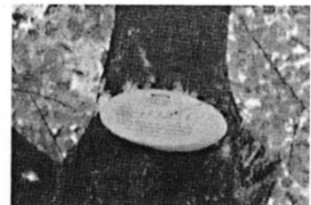
伐採樹木樹名札としても再利用された