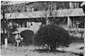
背丈ほどもある刈り込まれた移植樹木 (ドウダンツツジ)