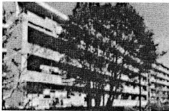
もとの場所で建替後も生き続ける保存樹 (サンゴシュ)