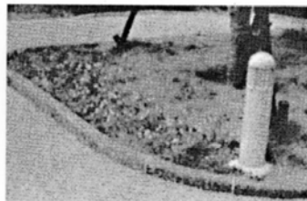
建替後も生活に安らぎとるおいをあたえる草花 (ハナニラ)