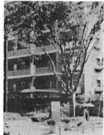
移植は団地内の他のエリアからも行われ、新たなシンボルとして生まれ変わった (ケヤキ)