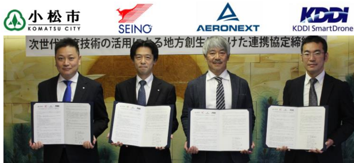
「次世代高度技術の活用による 地方創生に向けた連携協定」締結 (R4.12.13)

全国でドローン配送を展開しているパートナー企業と連携強化 ドローンを活用した地方創生プロジェクトの検討開始