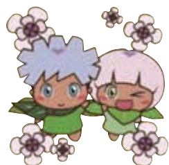
イメージキャラクター ひめちゃんといわおくん