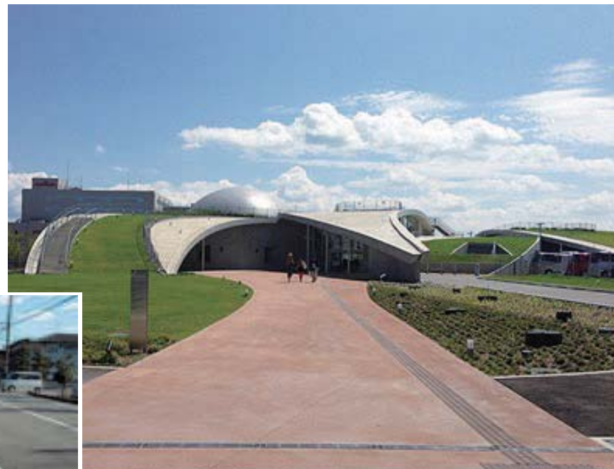
施工例：サイエンスヒルズ小松