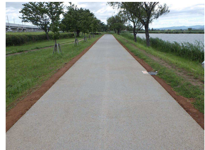
木場潟公園 園路(小松市)