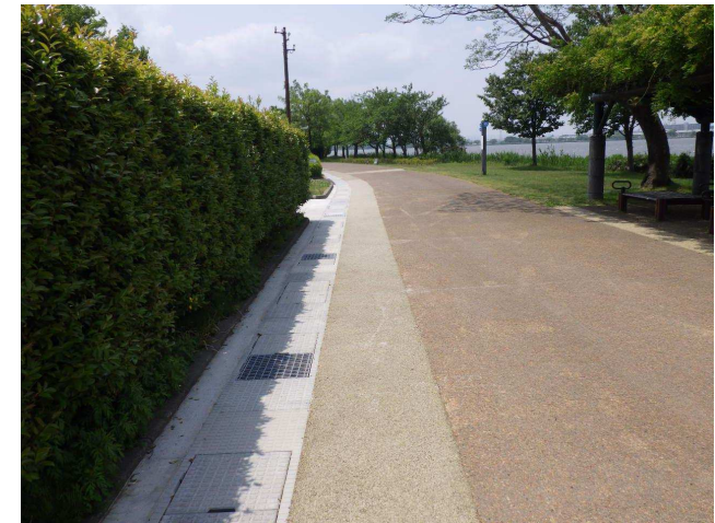
犀川緑地 園路(金沢市)