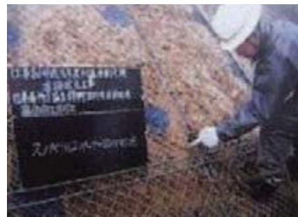
スペーサー設置状況