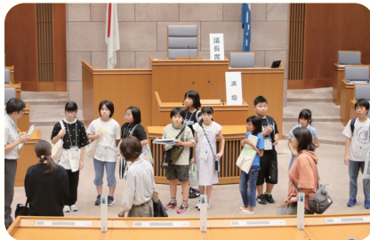
議場見学など議会の中を探検!