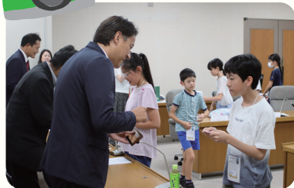
自分の名刺をもらって、議員と名刺交換!