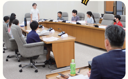
議員と直接、お話ができるよ!