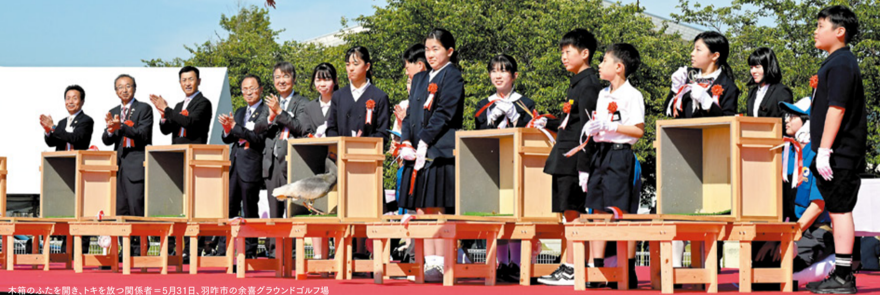
木箱のふたを開き、トキを放つ関係者 = 5月31日、羽咋市の余喜グラウンドゴルフ場

県議会は、県民の皆様の多様な意見が集まる場所です。身近な議員を通じて、皆様の「生の声」をぜひ議会にお寄せください。議長として、活発な議論が尽くされるよう議会をとりまとめ、石川県がより良くなるよう、全力で取り組んでまいります。