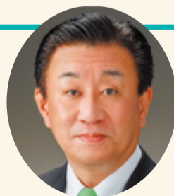
石川県議会副議長(119人目) 横山 隆也

議長をしっかりとお支えし、議会の円滑な運営と震災からの復旧・復興をはじめ、県勢の発展のため、精一杯の努力をしております。