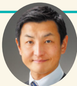
石川県議会議長(第108代) 不破 大仁

県議会は、県民の皆様の多様な意見が集まる場所です。身近な議員を通じて、皆様の「生の声」をぜひ議会にお寄せください。議長として、活発な議論が尽くされるよう議会をとりまとめ、石川県がより良くなるよう、全力で取り組んでまいります。