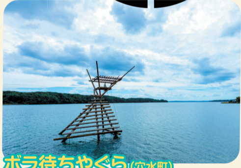
ボラ待ちやぐら (穴水町)